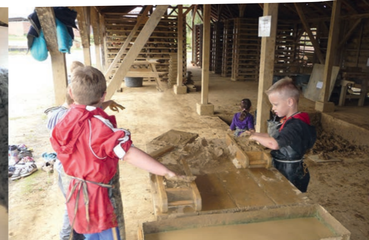
Praktisches Lernen – Exkursion zur Ziegelei in Lage

Unser pädagogisches Team verfügt über Zusatzqualifikationen in den Bereichen Dyskalkulie, Legasthenie, Hochbegabung und Psychomotorik.