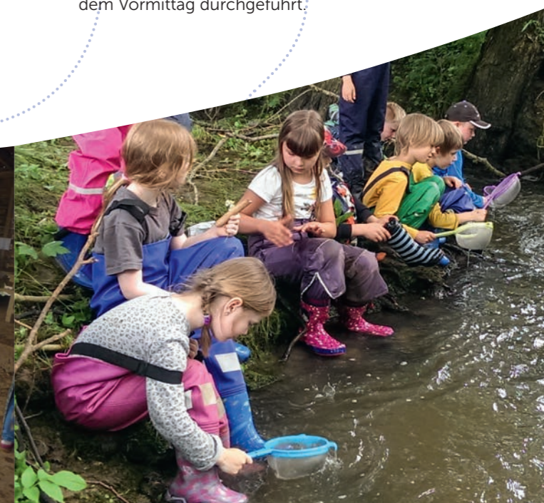
Nachmittags-Angebot – Expedition in den Forscherwald

Die Nachmittagsangebote und auch die Ferienspiele werden von unseren pädagogischen Fachkräften aus dem Vormittag durchgeführt.