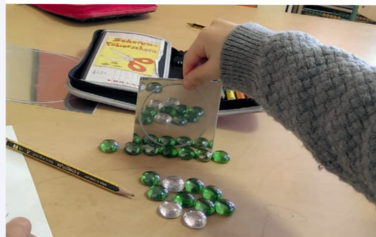
Ausprobieren und Entdecken – wir lernen verdoppeln

Mit einer zusätzlichen, pädagogischen Fachkraft in jeder Klasse hat unsere Schule mit ca. 10:1 einen besseren Betreuungsschlüssel als viele andere Schulen. Dies ermöglicht eine bessere Förderung und Forderung individueller Begabungen und Fähigkeiten der Schülerinnen und Schüler.