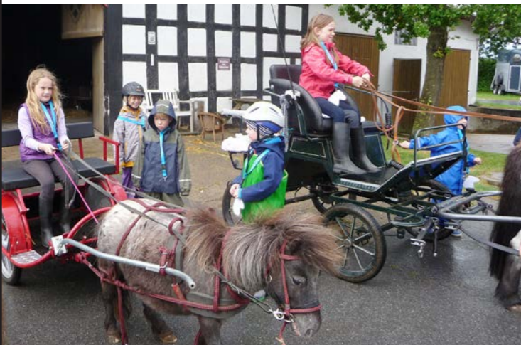
Mitmachen – Mit Ponys unterwegs.

Das Projekt wurde mehrfach mit dem »Preis für Finanzielle Bildung« ausgezeichnet.