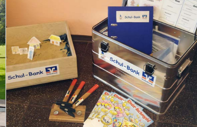
Die Schul-Bank – Banken, Geld und Märkte entdecken.