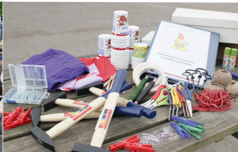
Unsere Forscherkiste – Wir verbinden Gegenstände.