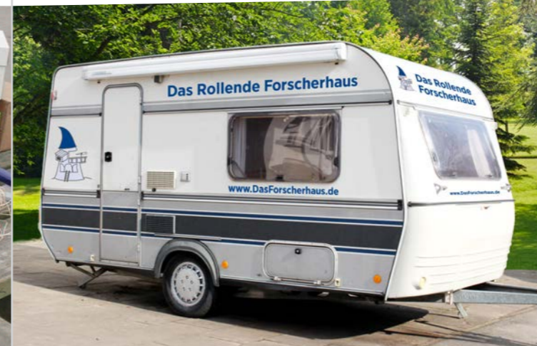
Das Rollende Forscherhaus kommt zu Ihnen.